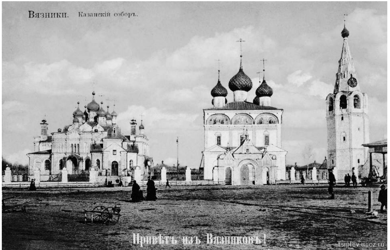
Вязники. Казанский собор.

С первого дня прихода к власти большевики начали богоборческую деятельность. 1922 год ознаменовался началом массового ограбления русских православных храмов по всей стране под видом реализации декрета «Об изъятии церковных ценностей на нужды голодающих». Многим